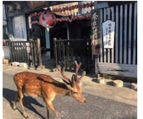
風情ある町に、鹿が訪れ人と共存するならまちの光景。

子どもたちには自分が暮らす町に関心を持ち、そこに住むことに誇りをもってほしい。そんな思いから、奈良町資料館に地元の小中学生を招き、時には学校に向いて世界遺産学習という体験授業を行っています。ならまちで使