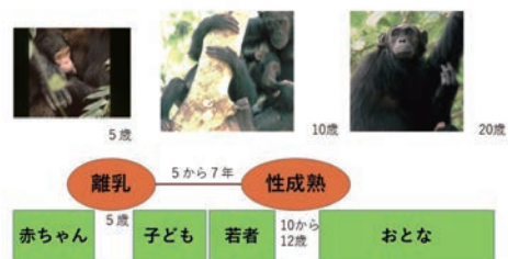
図2 チンパンジーの生活史

このように、ヒトは乳児期も短いと言えるのですが、離乳したあとの発達過程が、ヒトと他の類人猿ではまた違います。チンパンジー、ゴリラ、オランウータンの大型類人猿を含め、他の霊長類、いや他のすべての哺乳類では、一旦離乳すれば、あとは一人で食べていくのが普通です。離乳までの間は、親がいろいろとめんどうをみてくれますが、離乳したら最後、あとは一人で自立しな